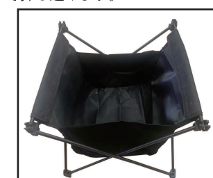
④布部を取り付け後の写真