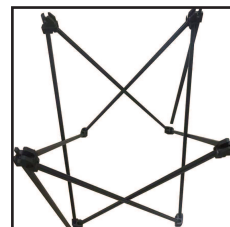
①フレームを開きます。