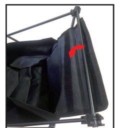
③布部をポール2本に取り付けます。