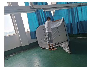
② 丸まっている状態から広げます。