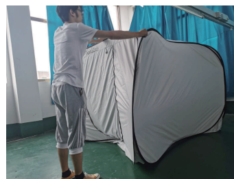
③ 正方形になるように、テントの形を整えます。