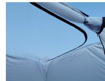
⑤ 天井や入口は紐で止めることができます。