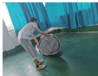
① 収納袋からテント本体を取り出します。