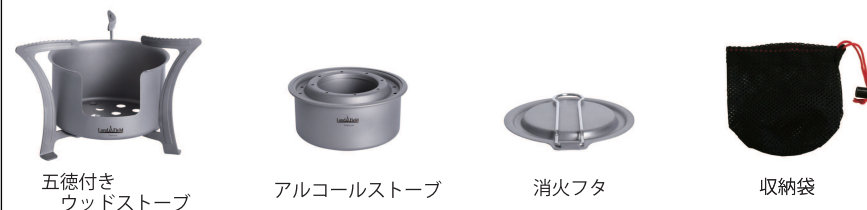
五徳付き ウッドストーブ